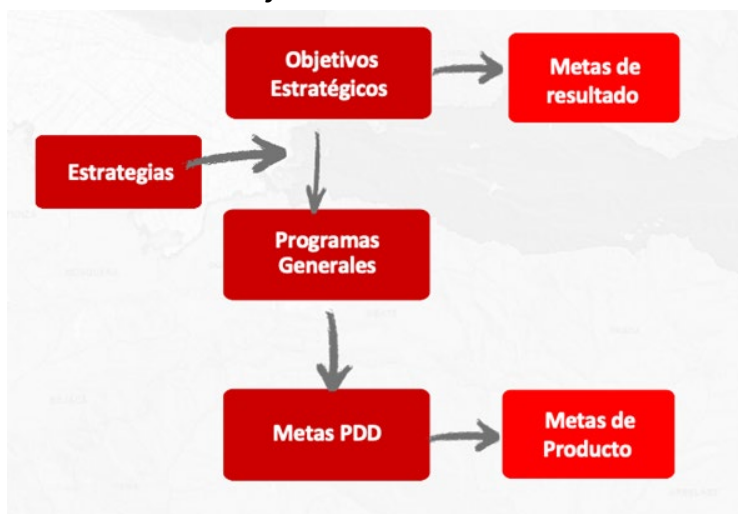
Gráfico 1. Estructura PDD

La estructura del Plan Distrital de Desarrollo 2024-2027 “ Bogotá camina segura ”, en adelante el Plan Distrital de Desarrollo, se concreta gráficamente así: